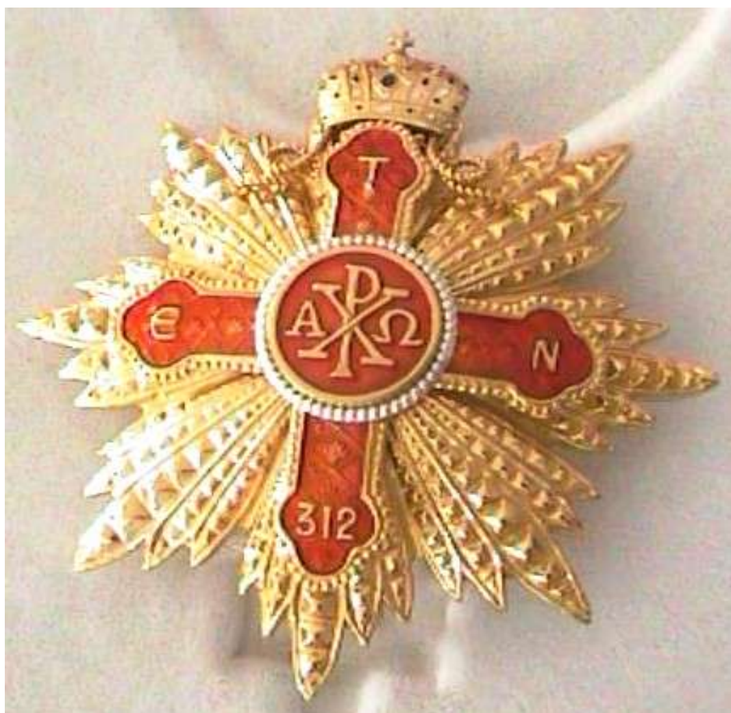
Ordine Costantiniano dei Lascaris Comneno (Spagna): Placca di Gran Croce di Giustizia moderna