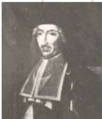
JUAN PABLO LASCARIS GRAND MASTER (1636-1657) ORDER OF MALTA Valletta, Malta

Era una goccia di acqua col ritratto del Gran Maestro dell'Ordine di Malta Juan Pablo Lascaris