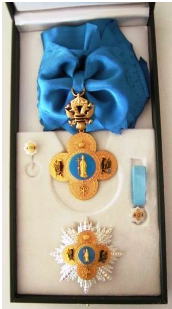
Il cofanetto relativo la Gran Croce del Molto Antico e Molto Augusto Imperiale Ordine di Sant'Elena Imperatrice (Casa Lascaris Comneno)