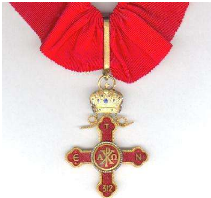
Commenda dell'Ordine di Costantino il Grande

Sovrano Ordine Imperiale di Costantino il Grande. Facente capo alla Casa Imperiale Lascaris 1 -Comneno, restaurato dopo la Guerra Civile in Spagna, operativo dal 1950 e con le decorazioni prodotte in Italia anche dalla Ditta Alberti e che riproduciamo alla pagina seguente. Si noti che la corona è di tipo imperiale e dotata delle infule.