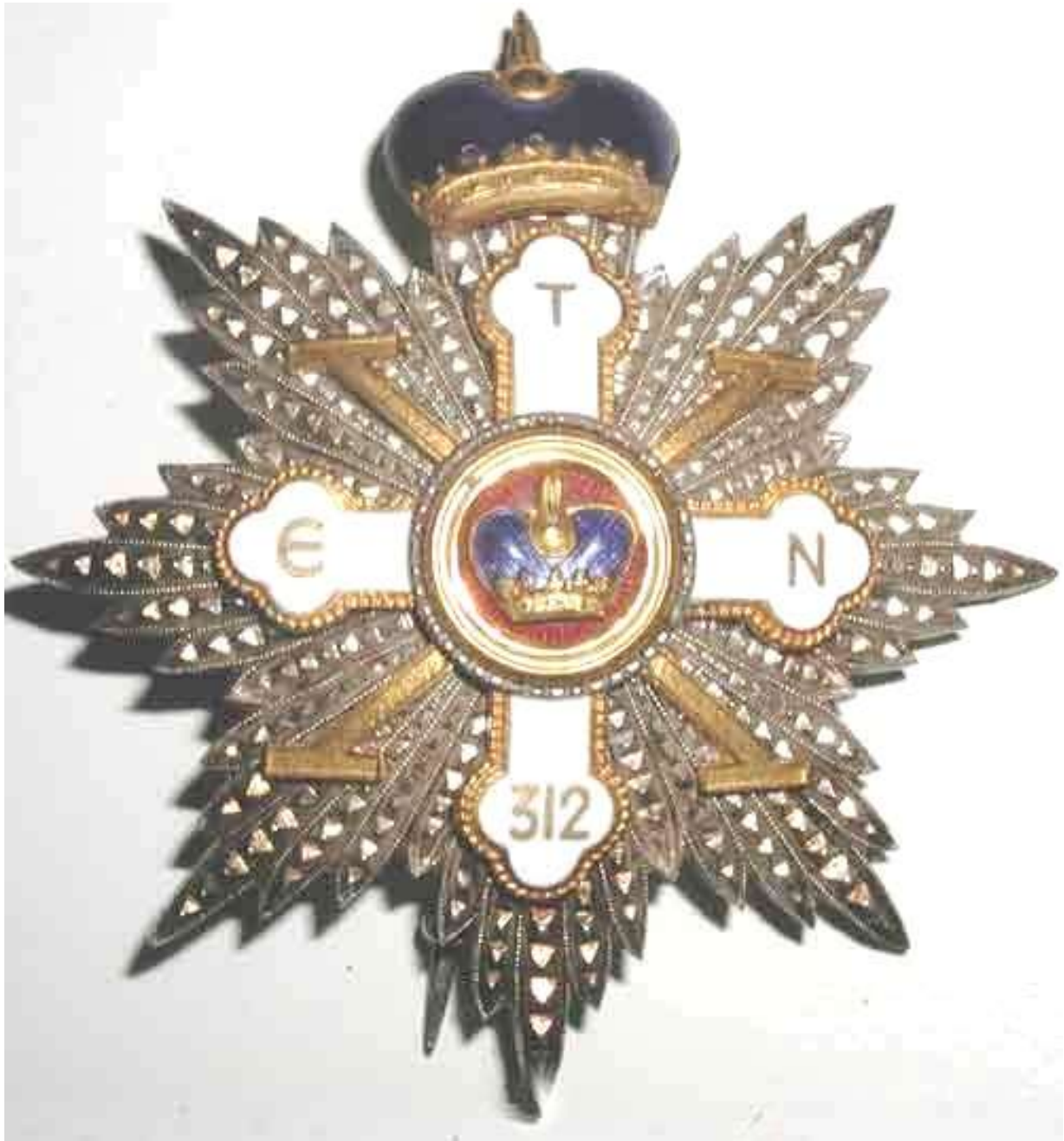
Ordine Costantiniano dei Lascaris Comneno (Spagna): Placca di Gran Croce di Giustizia antica