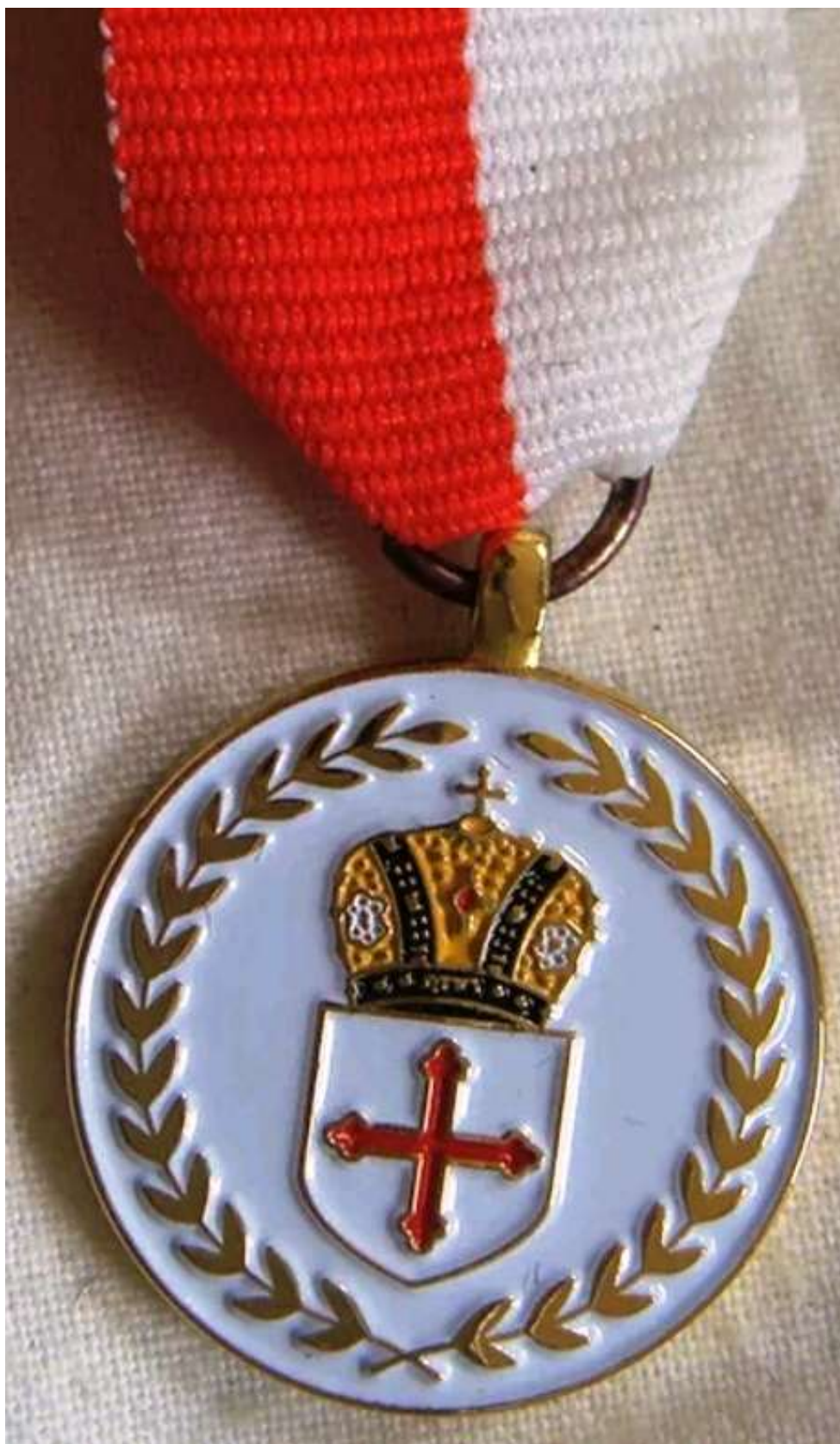
Medaglia Commemorativa per il 10° Anniversario dell'Ordine di San Costantino il Grande