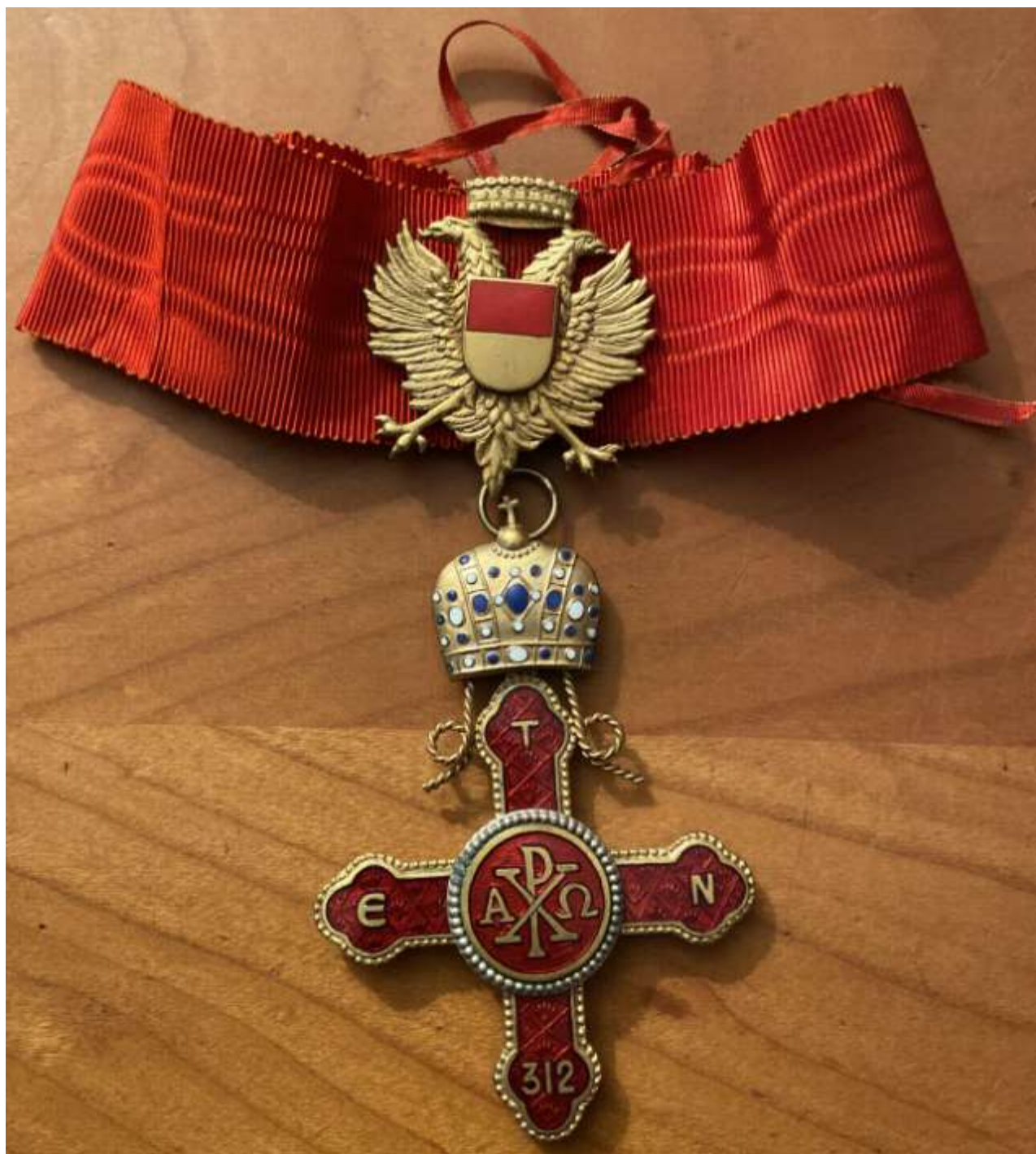
La Commenda dell'Imperiale e Sovrano Ordine di San Costantino il Grande. Lo scudo riprende lo stemma dei Lascaris