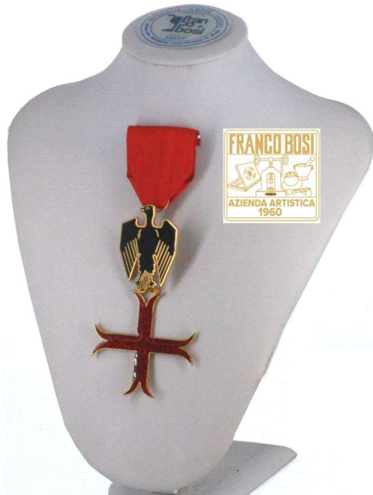
Commendatore dell'Ordine Templare denominato in acronimo OSMTJ. Prodotto dalla storica Ditta Franco Bosi, Vimodrone (MI). Sito Web: http://www.bosifranco.it/