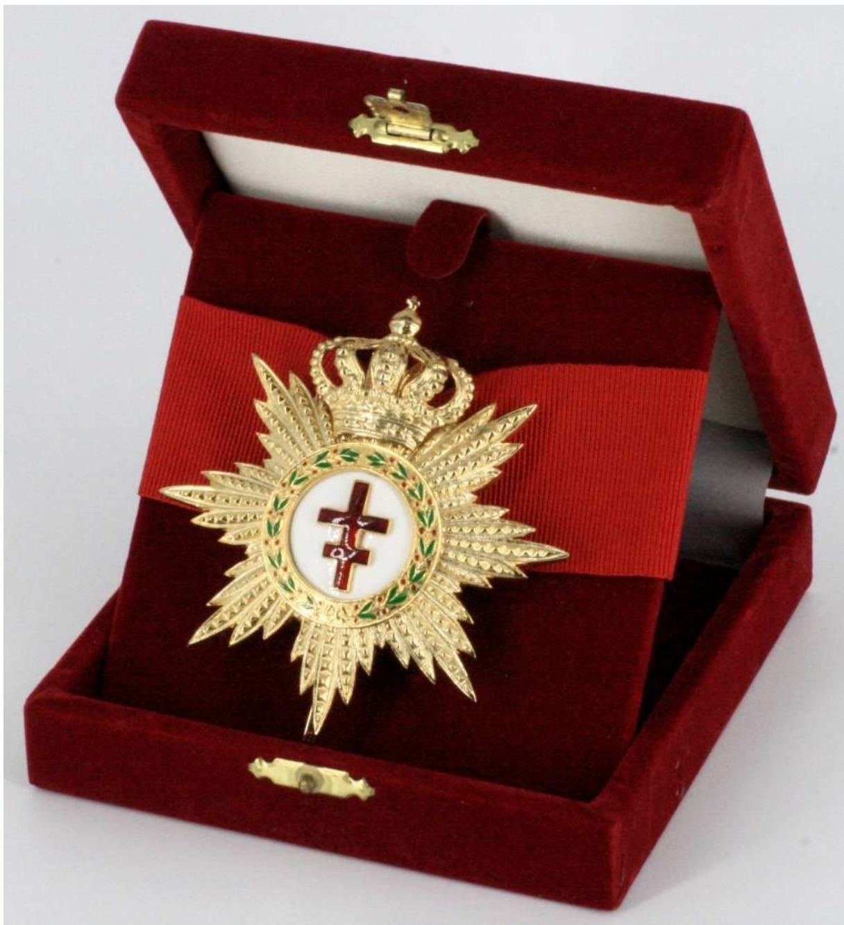
Cavaliere di Gran Croce di Giustizia di un Ordine Templare. Prodotto dalla storica Ditta Franco Bosi, Vimodrone (MI).