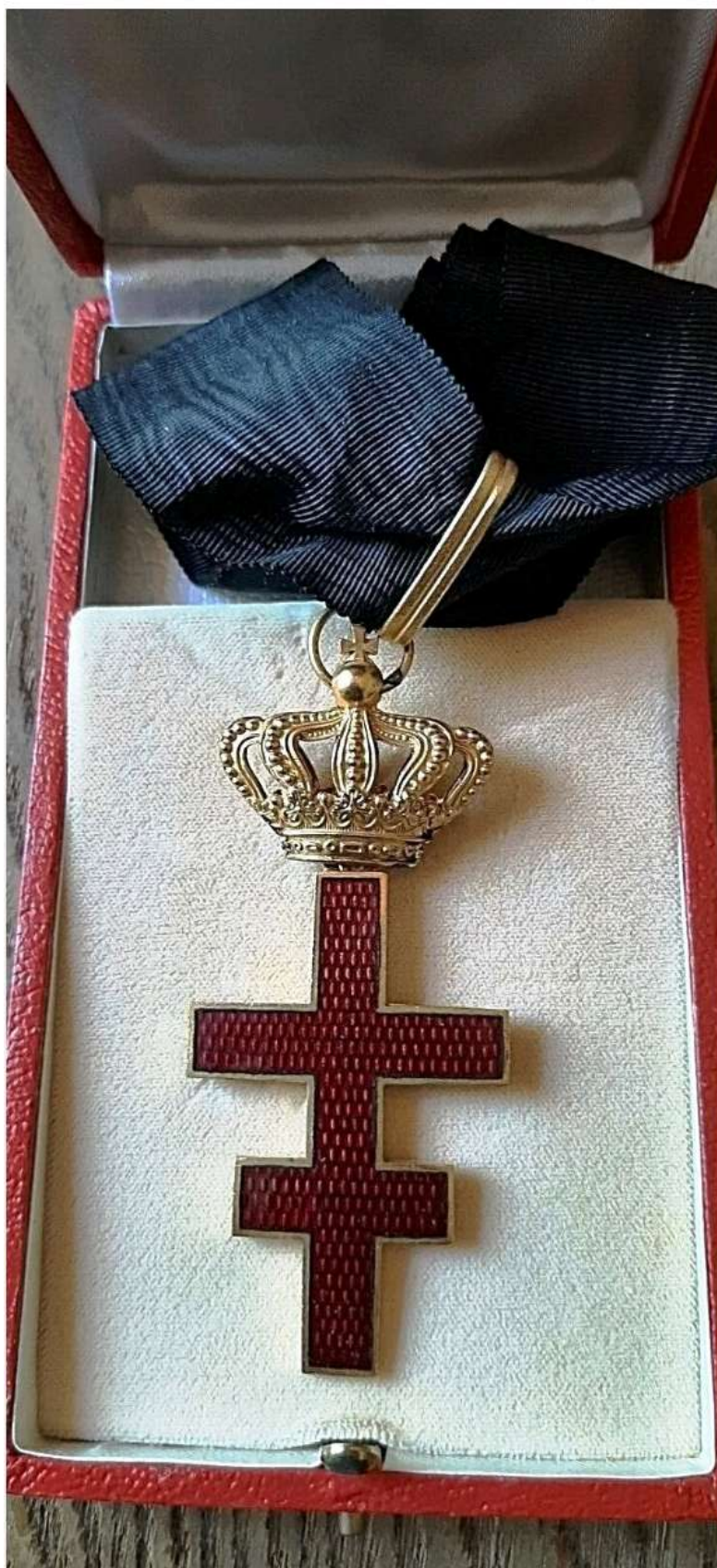
Decorazione vintage da Commendatore di un Ordine Templare