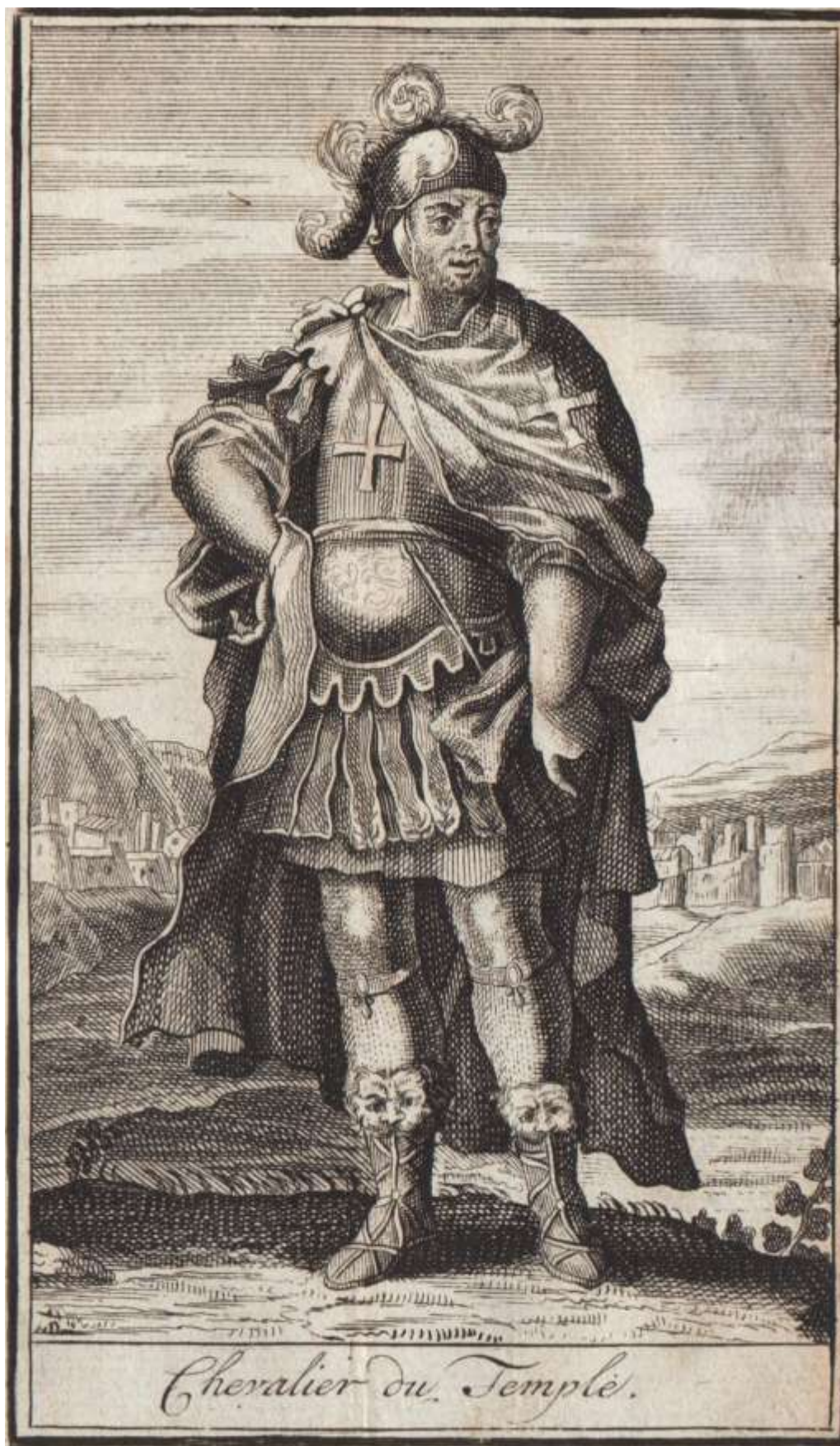
Cavaliere dell'Ordine del Tempio in una incisione del 1721