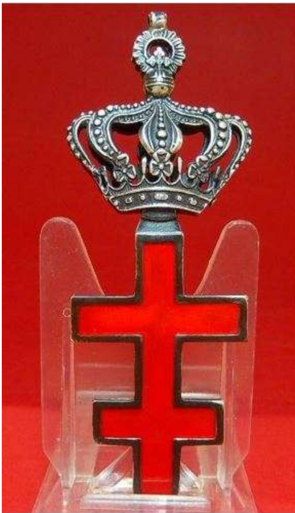
Antica croce templare primi '900. Spagna.