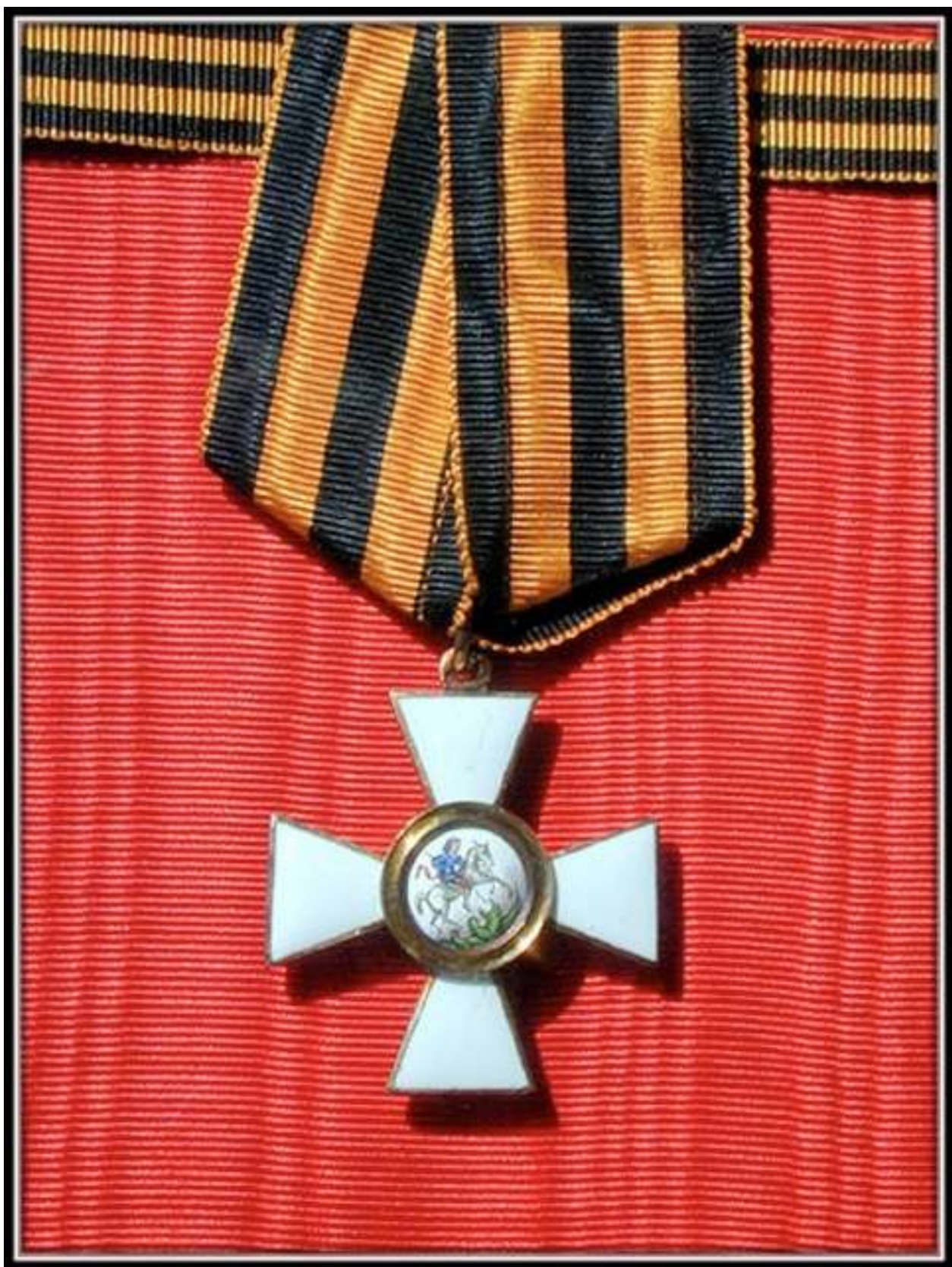
Quarta Classe dell'Ordine Imperiale Russo di Sant'Andrea, circa 1850