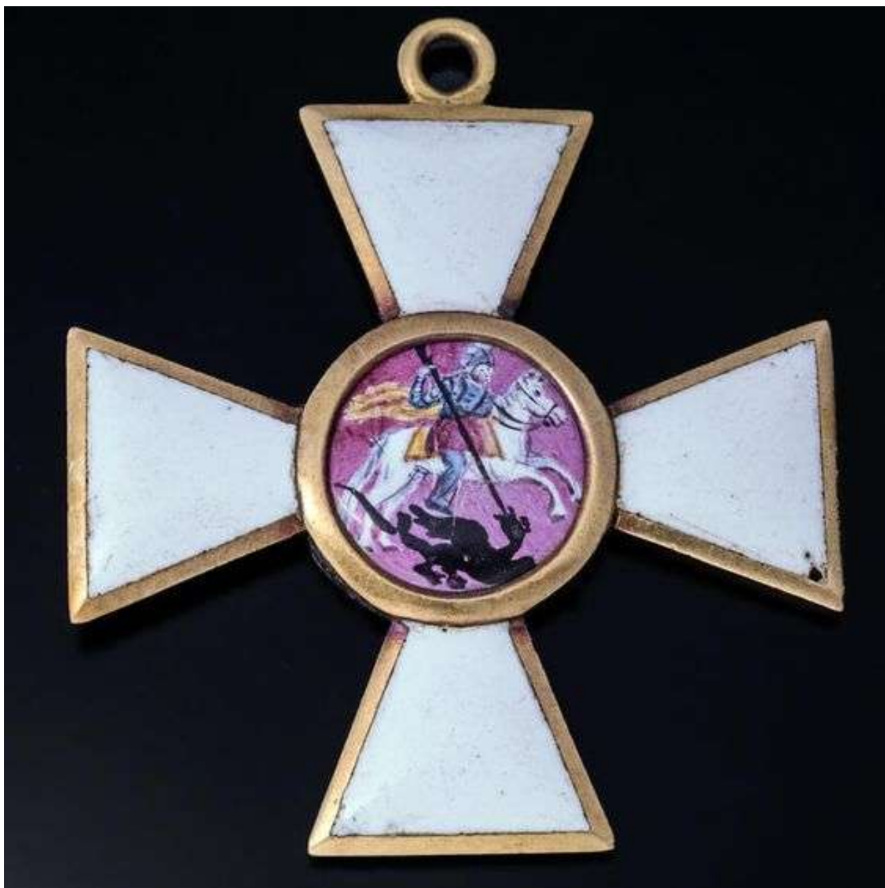
La Croce di Terza Classe dell'Ordine di San Giorgio dell'Impero Russo, 1815 circa