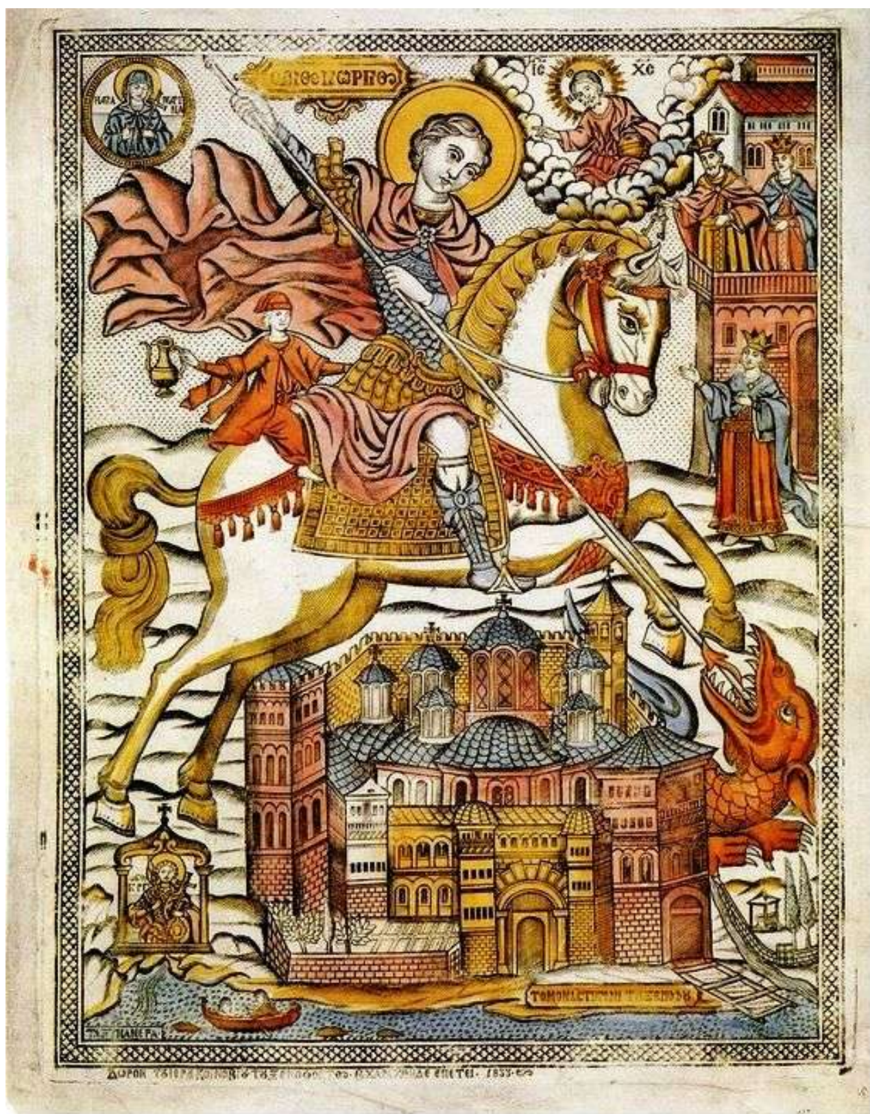
San Giorgio Megalomartire mentre uccide il Drago. Arte Russa antica. Collezione Privata.