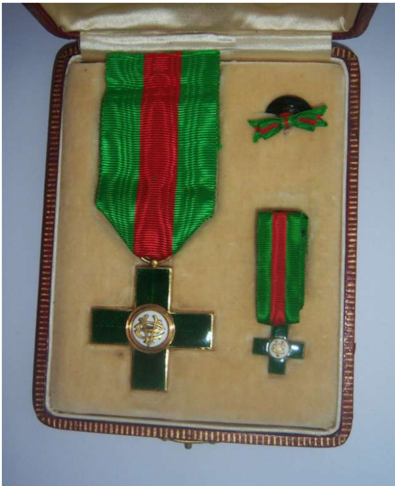
Visibile sopra ed ancor prima, fronte e retro, nel cofanetto, la Croce da Cavaliere dell'Ordine al Merito del Lavoro di epoca monarchica.