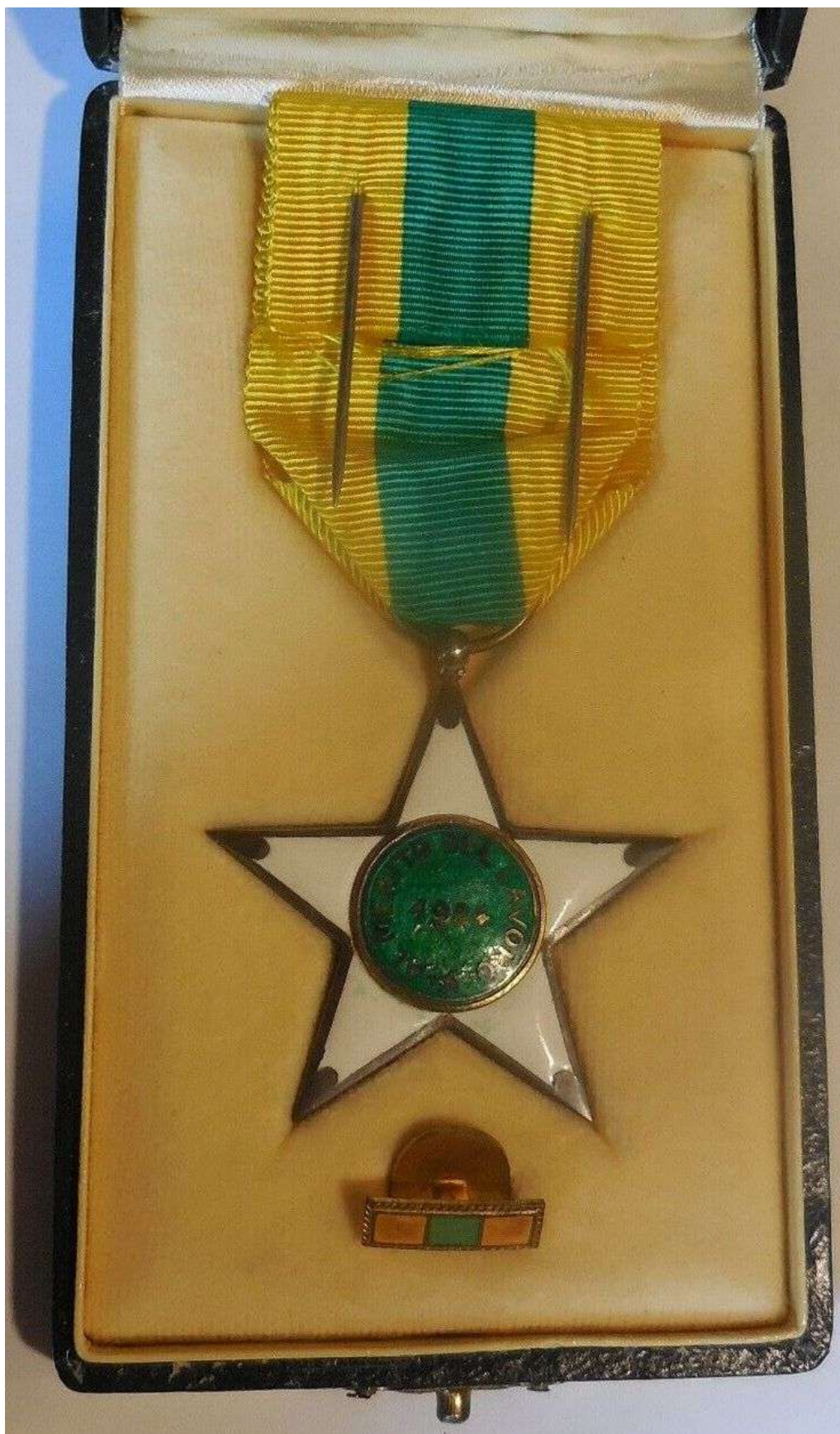
Stella al Merito del Lavoro (retro)