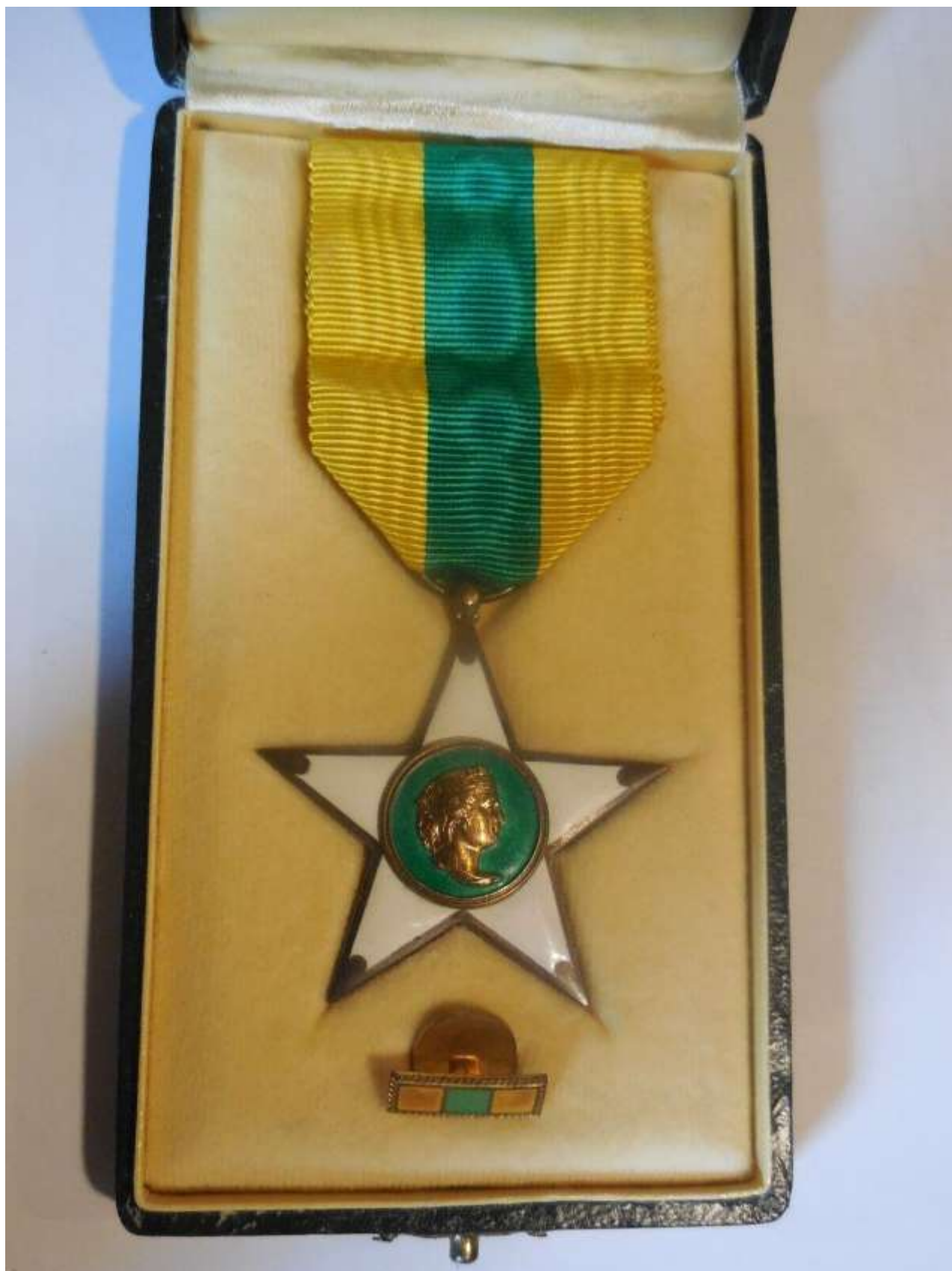
Stella al Merito del Lavoro (fronte)