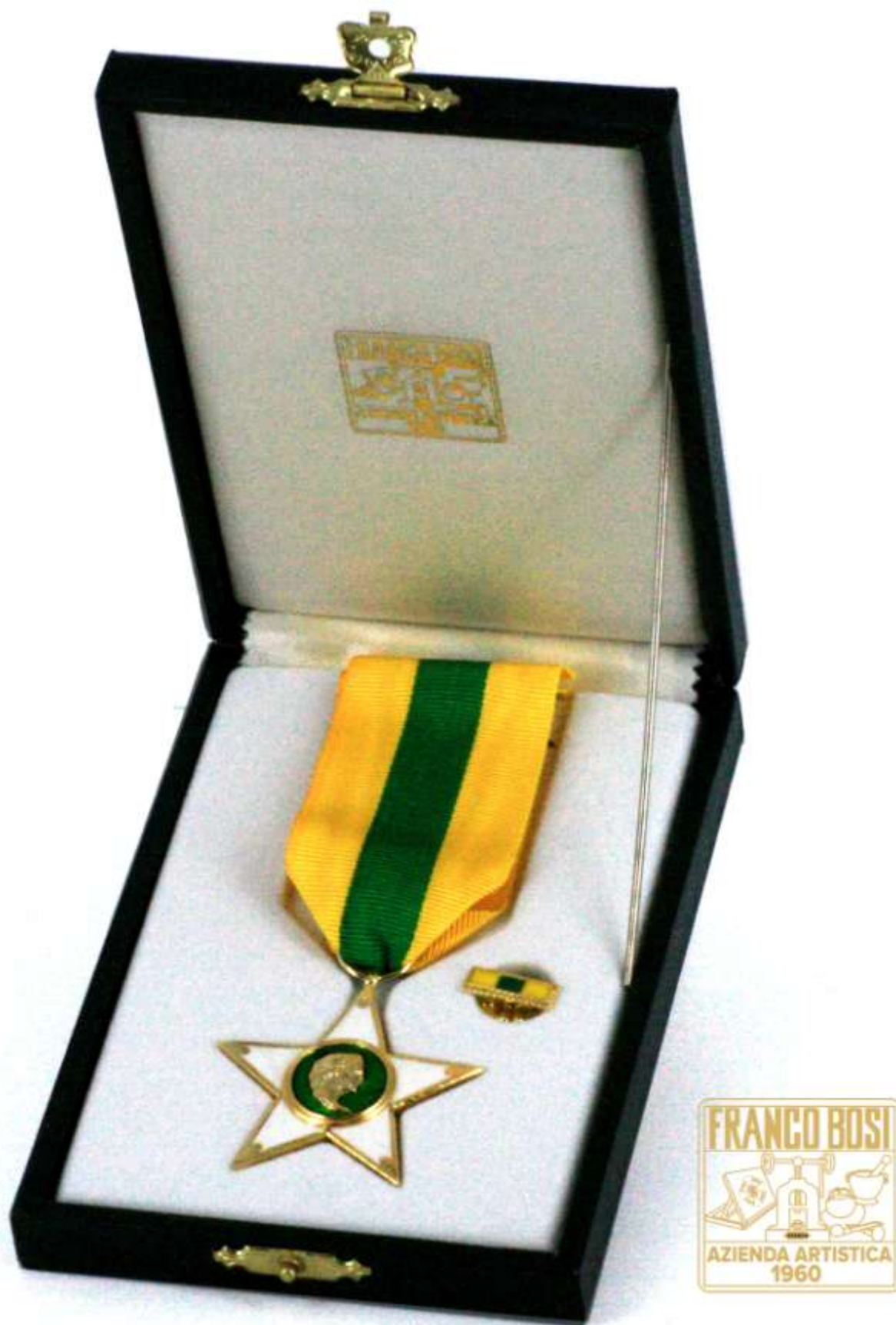
Cofanetto relativo la Stella al Merito del Lavoro creato dalla storica Ditta Franco Bosi di Milano/Vimodrone. Veggasi, per maggiori informazioni, la seguente pagina Web Ufficiale: http://www.bosifranco.it/