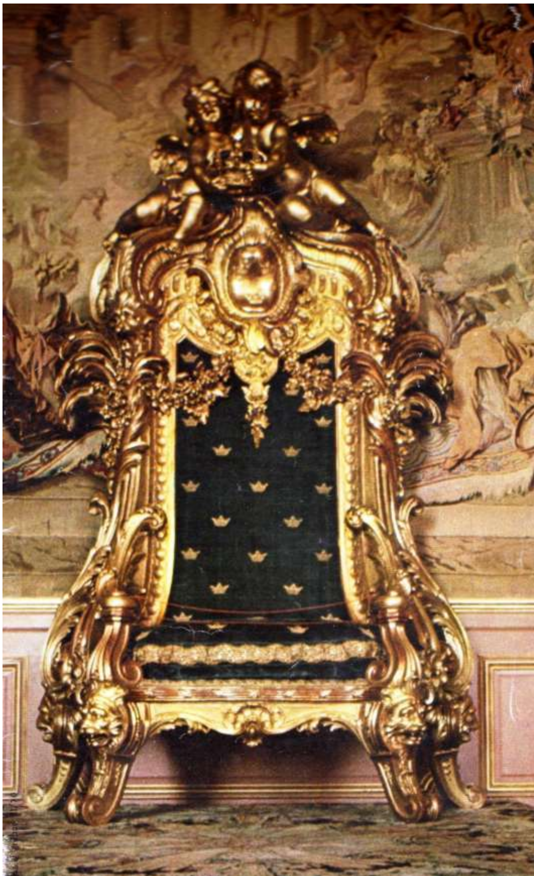
Un magnifico Trono dorato.