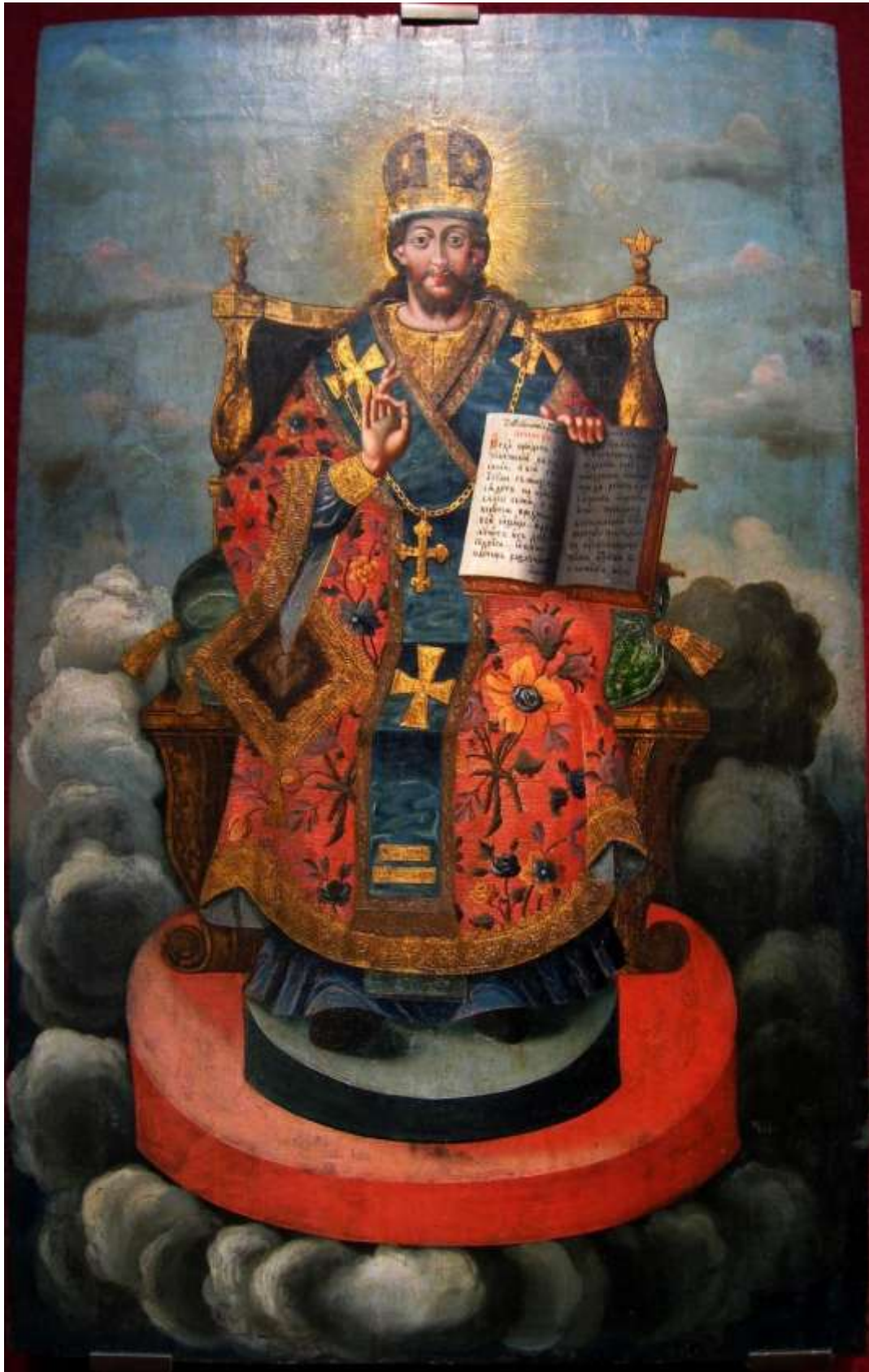
Cristo assiso in Trono