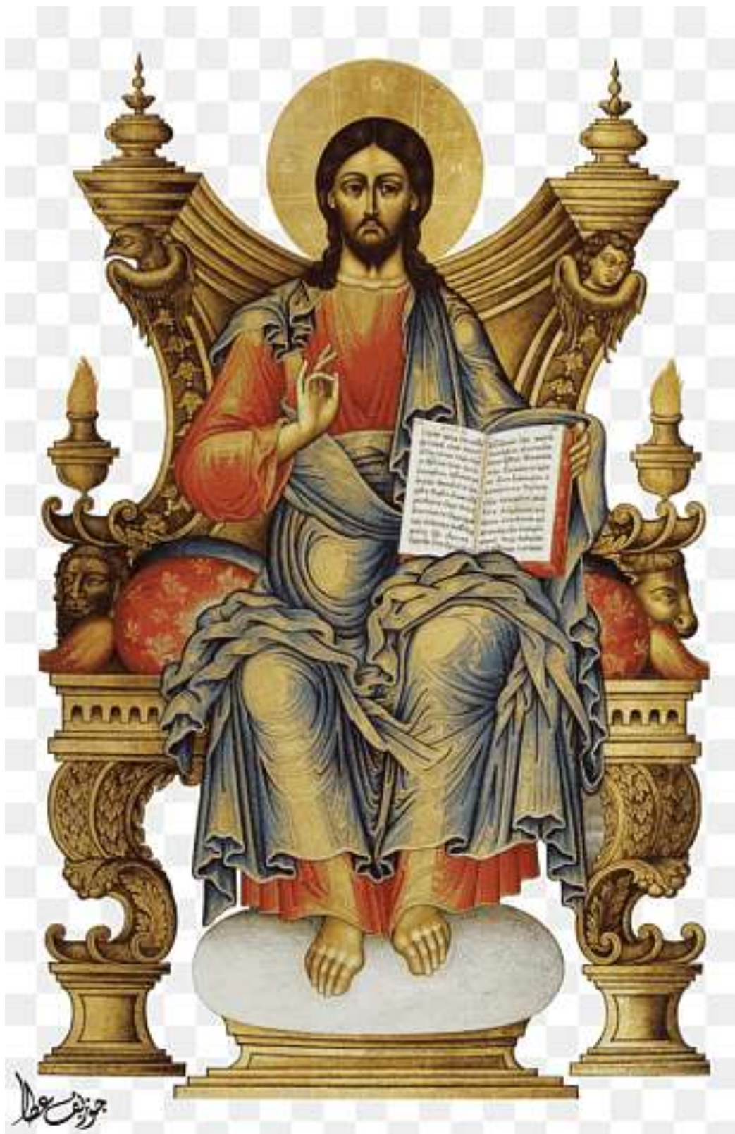
Cristo in Trono. Una magnifica icona Copta Egiziana. Collezione Privata.