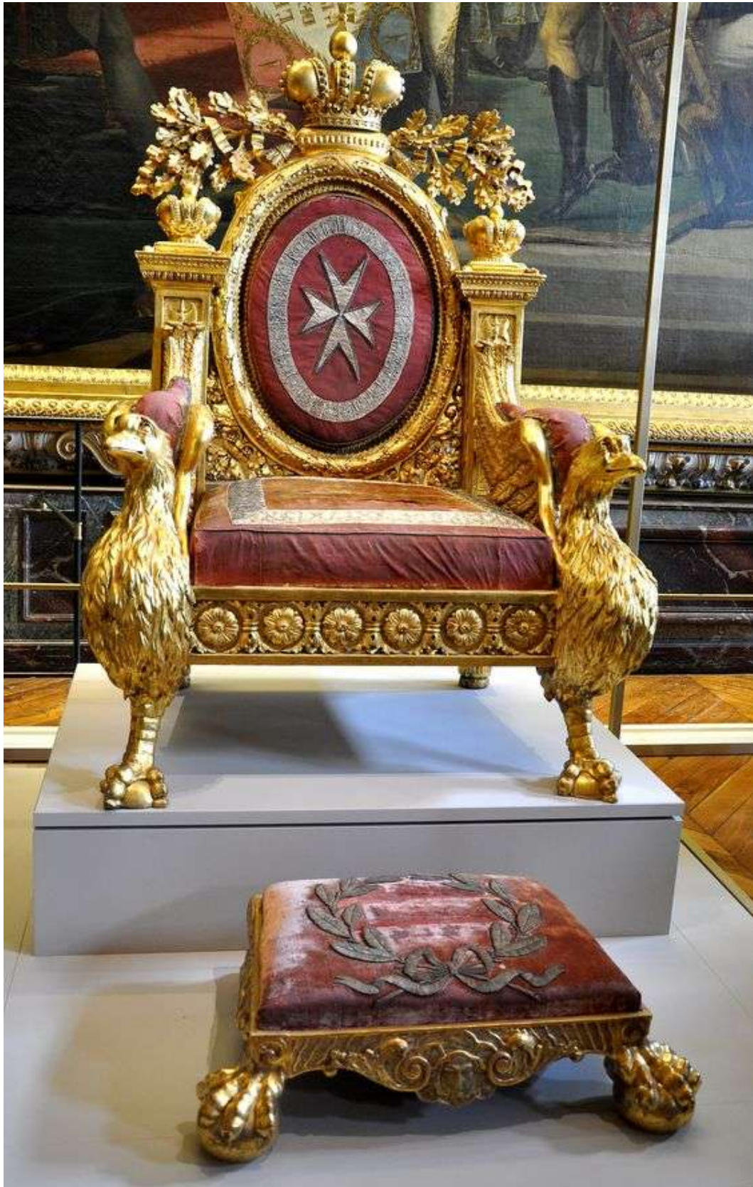
Trono dell'Imperatore/Zar Paolo I di Russia quale Gran Maestro dell'Ordine di Malta.