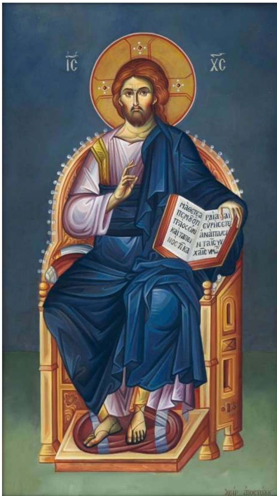
Cristo assiso in Trono