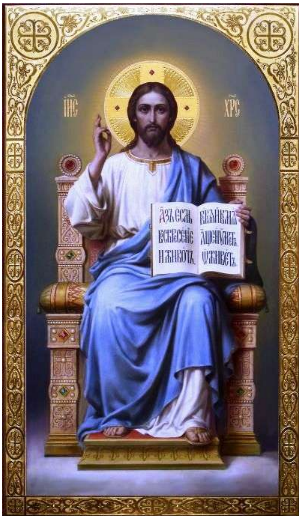
Cristo assiso in Trono