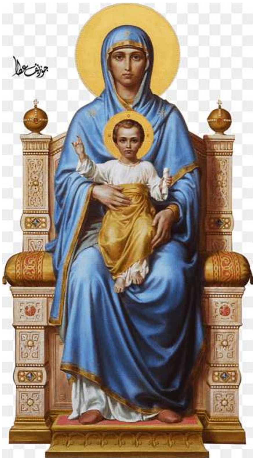
La Madonna e Gesù Bambino in Trono. Una magnifica icona Copta Egiziana. Collezione Privata