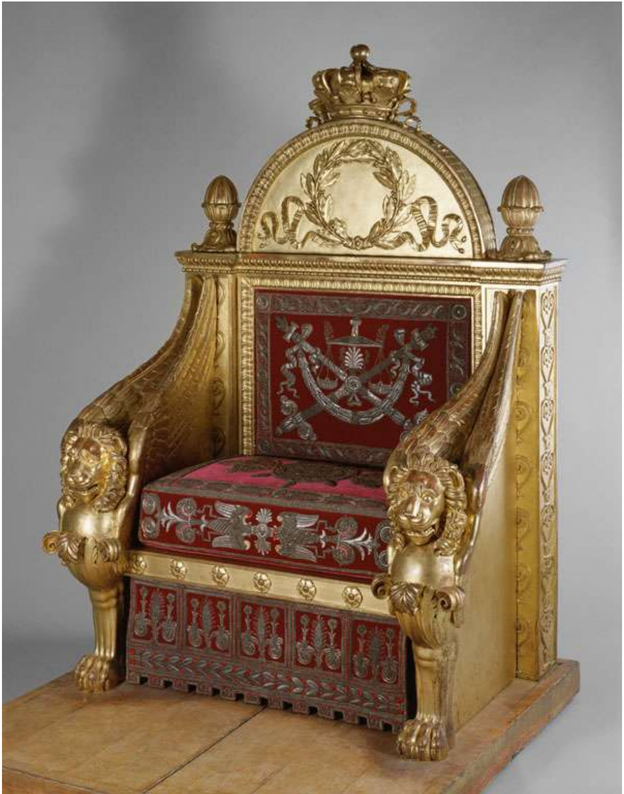
Un magnifico Trono dorato. Da un Blog poi scomparso.