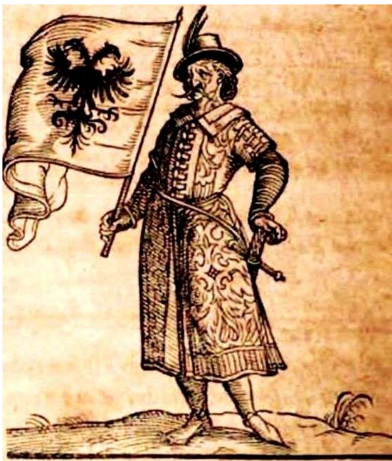
Il Principe Giorgio Castriota riprodotto entro un libro antico