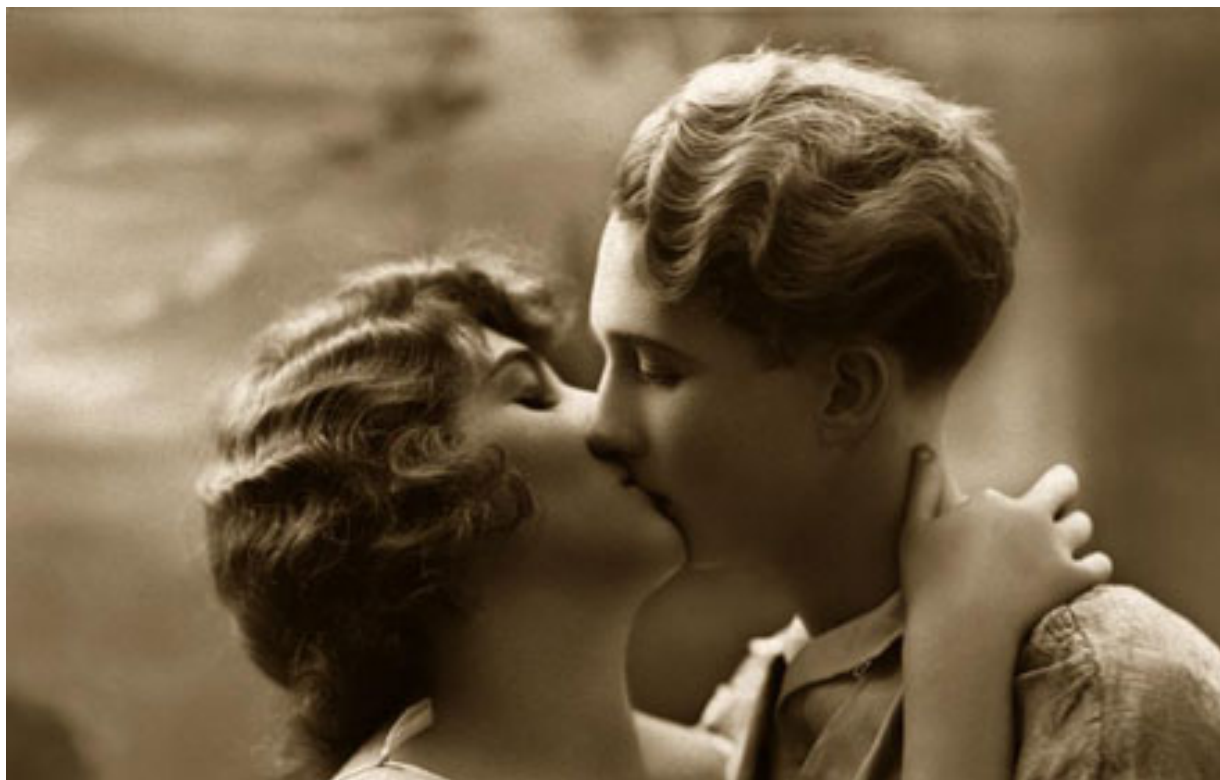
Un bacio romantico eterosessuale fra innamorati da una cartolina “ Vintage ”