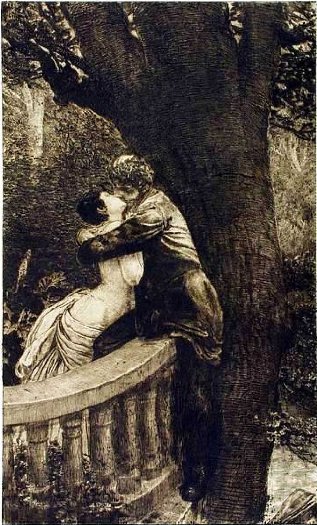
Opera di Max Klinger.

Max Klinger (Lipsia, 18 febbraio 1857 – Großjena, 4 luglio 1920) è stato un Pittore e Scultore tedesco. Veggasi, per maggiori informazioni, la seguente pagina web: http://it.wikipedia.org/wiki/Max_Klinger